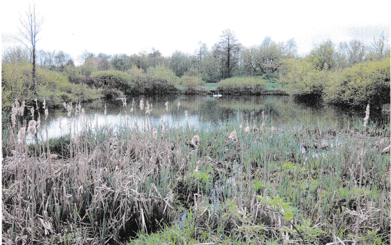
Dawny basen na ul. Kąpielowej