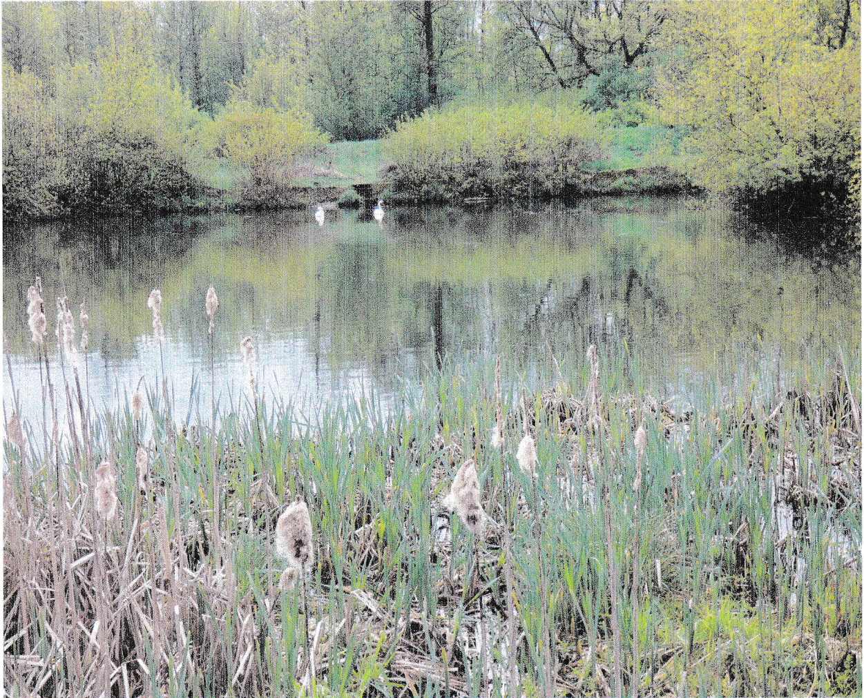
Dawny basen na ul. Kąpielowej