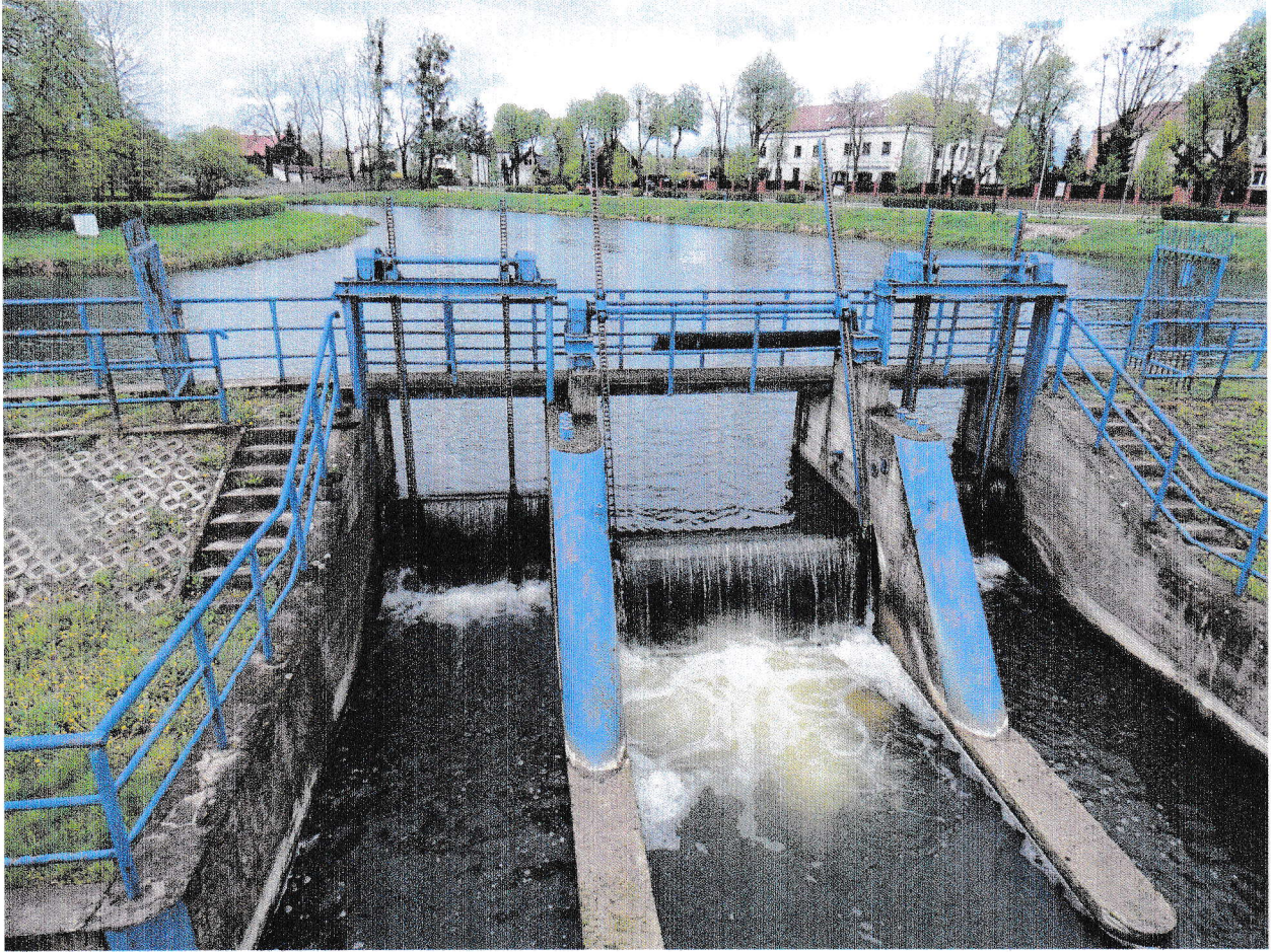
Jaz na Rzece Węgiec