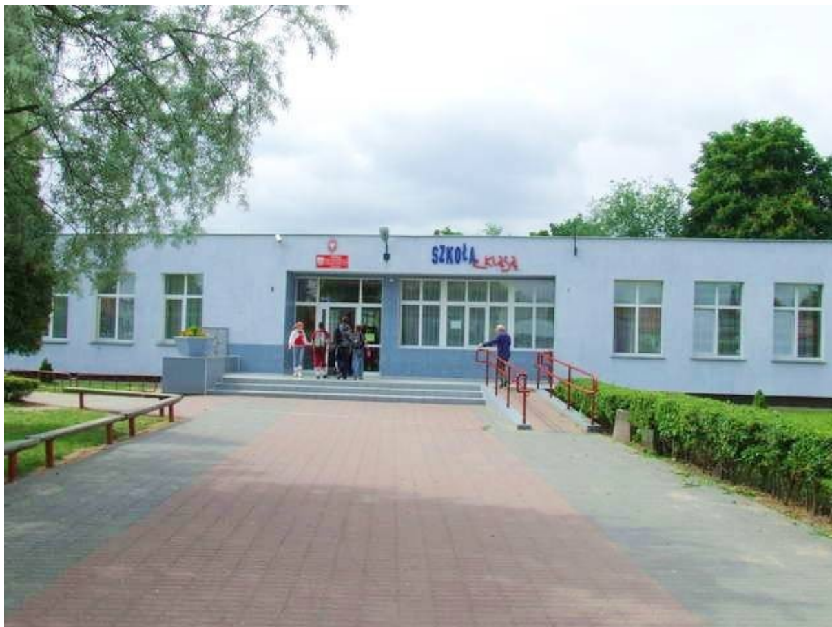
Zdjęcie nr 4. Budynek Szkoły Podstawowej nr 1 z Oddziałami Integracyjnymi w Przasnyszu przy ul. Szkolnej 2