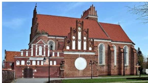
Rysunek 7. Widok na Kościół pw. Św. Jakuba i Anny.

KOŚCIÓŁ PW. ŚW. JAKUBA I ANNY Kościół wzniesiony dla zakonu Bernardynów sprowadzonych do Przasnysza w 1588 r. Stanowi świadectwo obecności w Przasnyszu ojców Bernardynów od roku 1588 aż do kasaty zakonu w 1864 r. Zrujnowane w czasie I wojny światowej budynki w 1923 r. przejął klasztor OO. Pasjonistów. W czasie II wojny światowej kościół zamieniono na spichlerz.