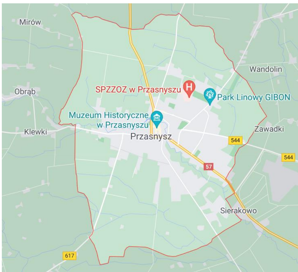
Rysunek 1. Granice miasta Przasnysz [2].

Miasto otoczone jest prawie w całości gminą Przasnysz, a na krótkim odcinku, niespełna 1,4 km, na zachodzie graniczy z gminą Czernice Borowe.