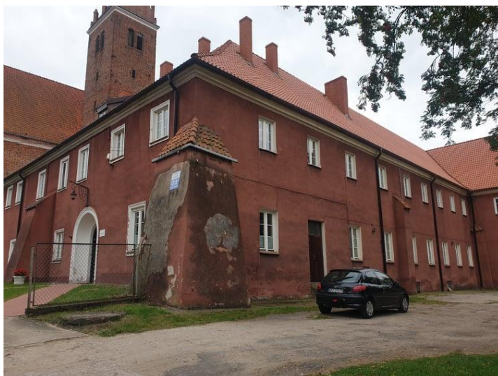
Rysunek 8. Widok na Klasztor Pobernardyński.

KLASZTOR POBERNARDYŃSKI Obiekt wczesnobarokowy. Przylegający od północy do kościoła pw. Św. Jakuba i Anny. Trzy skrzydła klasztoru i budynek kościoła otaczają prostokątny wirydarz. Skrzydła dwukondygnacyjne, przykryte dwuspadowymi dachami. Dachy kryte dachówką. W czasie II wojny światowej w klasztorze mieściły się szpital i więzienie.