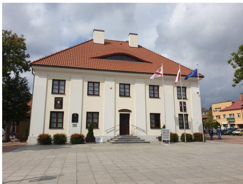
Rysunek 3. Widok na budynek Ratusza.

Klasycystyczna bryła oraz podcienia nawiązujące do modnego w latach 20-tych XX w. tzw. stylu narodowego.