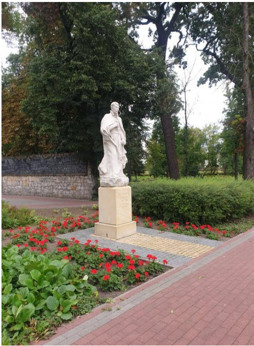
Rysunek 14. Pomnik Św. Stanisława Kostki na terenie Parku Miejskiego – patrona miasta.

Drugim parkiem zlokalizowanym na terenie miasta jest park przy dawnej szkole rolniczej przy ul. Ruda 1. Park jest w kształcie nieregularnego wieloboku, zbliżonego do trapezu o osi wydłużonej z południa ku północy.