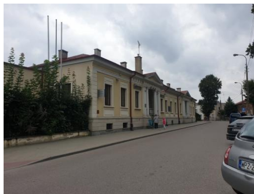
Rysunek 4. Widok na budynek przy ul. 3 Maja 13.

Jest to jeden z najstarszych zachowanych budynków mieszkalnych w Przasnyszu, wzniesiony w 1807 r. dla generała pruskiego Rouquette. W okresie międzywojennym mieściło się tu starostwo powiatowe, obecnie siedziba banku Pekao S.A. Obiekt był remontowany w latach 1933-1995 i 2006. Ten klasycystyczny budynek, o dość bogatym detalu architektonicznym, jest wyjątkowym tego typu obiektem na terenie miasta. Stanowi wyjątkowy na terenie miasta przykład zastosowania tego typu form w obiekcie o przeznaczeniu mieszkalnym.