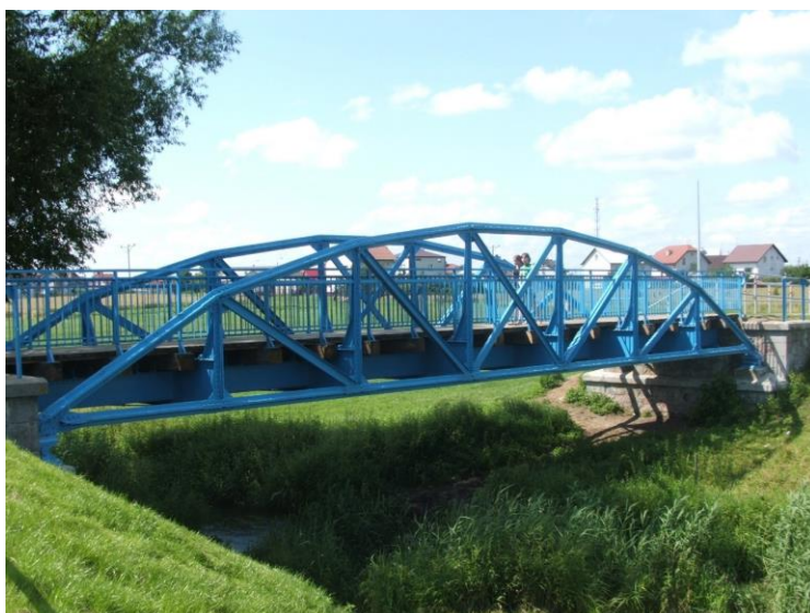
Rysunek 13. Widok na most na rzece Węgiejrze, dawny most kolejowy – obecnie ścieżka rowerowa.