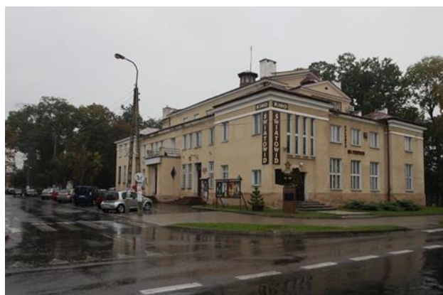
Rysunek 5. Widok na budynek przy ul. 3 Maja 16.

Budynek przedstawia wartość artystyczną i naukową stanowiąc obiekt o wyjątkowym charakterze w krajobrazie miasta. Zarówno ze względu na pełnioną funkcję, determinującą jego duży gabaryt oraz nawiązanie do architektury neoklasycystycznej stanowi obiekt unikalny w skali miasta. Wzniesiony na planie prostokąta konstrukcji zbliżonej do bazyliki ze ścianami sali widowiskowej zaopatrzonymi w okna i wystającymi ponad dach naw bocznymi.