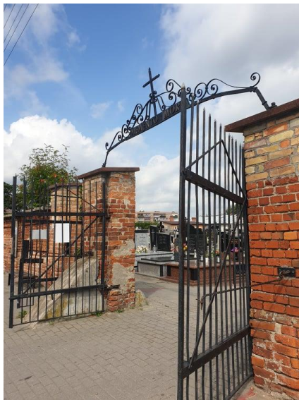
Rysunek 16. Widok na bramę wejściową Cmentarza rzymsko – katolickiego w Przasnyszu.

W centrum miasta u zbiegu ulic Ostrołęckiej i Baranowskiej istnieje jeden czynny cmentarz katolicki założony na początku XIX w.