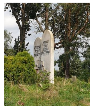
Rysunek 15. Widok na Cmentarz żydowski przy ul. Leszno 45.

W głębi cmentarz otoczony jest użytkami rolnymi. Teren cmentarza jest lekko nachylony ku północy, w stronę rzeki Węgiejki.