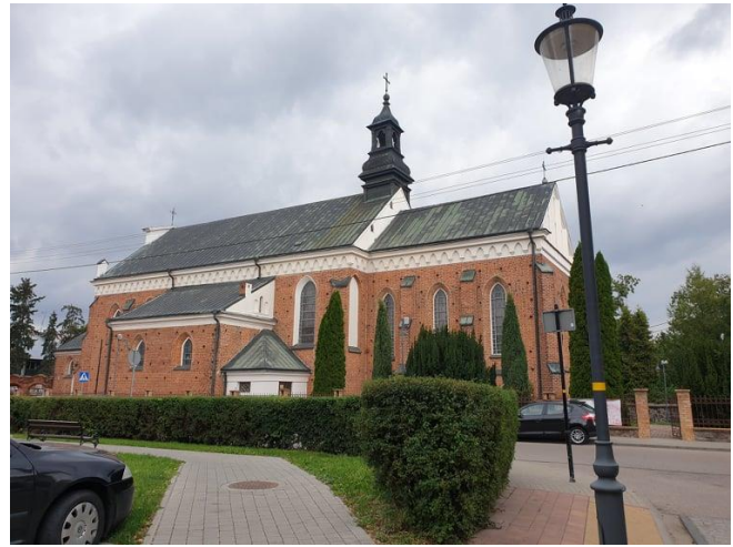
Rysunek 9. Widok na Kościół pw. NMP.

Kościół orientowany. Murowany z cegły (wątek gotycki), nietynkowany, oszkarpowany. Dach dwuspadowy, kryty blachą. Kościół jednonawowy, z nieco węższym i niższym, zamkniętym prosto prezbiterium. Do nawy od północy i południa przylegają dwuprzęsłowe kaplice boczne, poprzedzone od wschodu niskimi kruchtami. Do południowo-zachodniego narożnika kościoła przylega ceglany, nietynkowany mur o barokowej formie. Mur łączy budynek kościoła z dzwonnica.