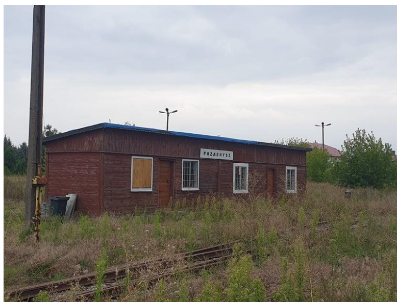
Rysunek 12. Widok na budynek stacyjny dawnej kolei wąskotorowej – zrewitalizowany w ostatnich latach.

Do ważniejszych elementów na terenie miasta należy drewniany budynek stacyjny z ok. 1925 roku oraz most stalowy na rzece Węgiec.