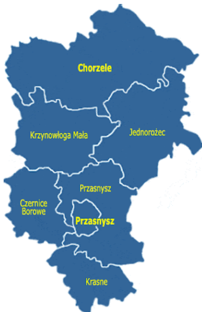
Rysunek 2. Położenie miasta na tle powiatu przasnyskiego [3].