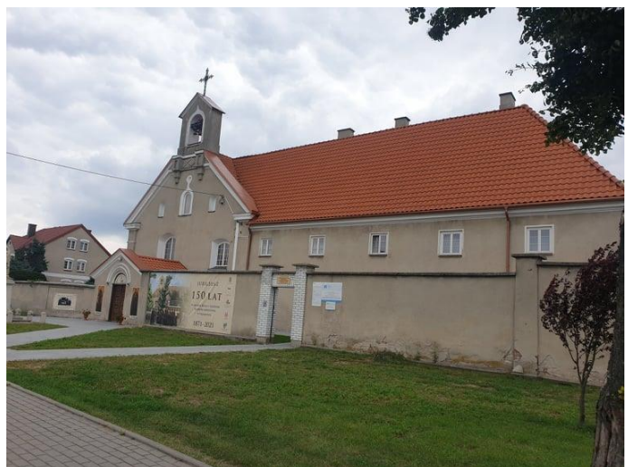
Rysunek 10. Widok na Zespół Klasztorny Bernardynek.

Kościół p.w. św. Klary i Józefa pochodzi z lat 1609-1616, budowę klasztoru ukończono w 1615 roku. Oba budynki zostały zniszczone przez pożary w 1622 i 1645 r., następnie odbudowane w latach 1685 i 1786-9, a odrestaurowane w 1840 r. Ponownie zostały uszkodzone w czasie I wojny światowej i odremontowane po 1916. Podczas II wojny światowej zamienione przez Niemców na więzienie, później spichlerz. W latach 80. XX w. dobudowane zostało nowe skrzydło klasztorne.