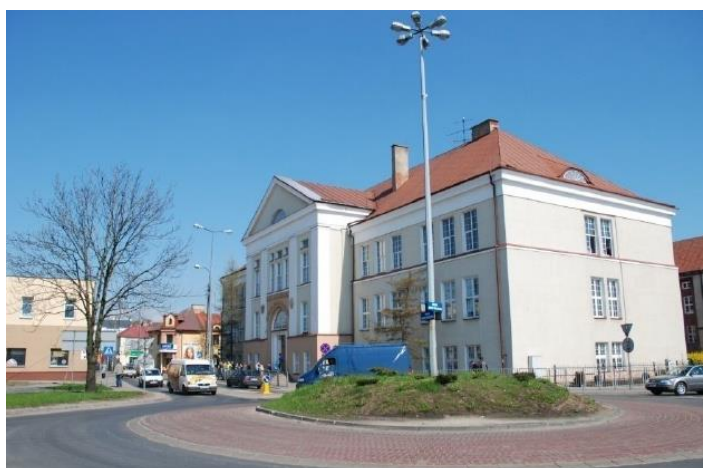
Rysunek 6. Widok na budynek obecnego Liceum Ogólnokształcącego.

Świadczy o tym fakt, że otwarcia nowo wybudowanej szkoły w 1924 roku dokonał Prezydent Rzeczypospolitej Polskiej – Stanisław Wojciechowski. Budynek pełni nieprzerwanie tę samą funkcję. Monumentalna bryła budynku o oszczędnym detalu architektonicznym stanowi późną redakcję neoklasycyzmu.