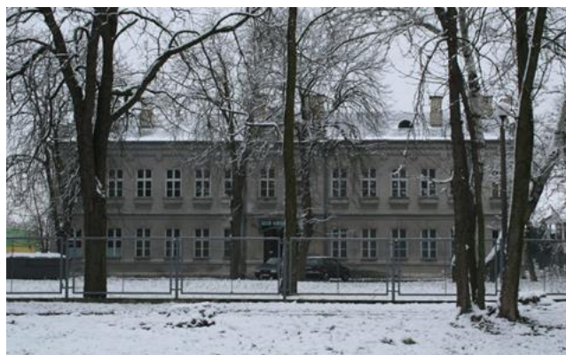
Rysunek 11. Widok na budynek nr 3 na terenie dawnego zespołu koszarowego – wpisany do Rejestru Zabytków Województwa Mazowieckiego.

Budynki stanowią element powstałych na początku XX w. Koszar carskich, które przez dziesięciolecia stanowiły miejsce stacjonowania zaborczych wojsk. Po roku 1915 w miejsce Rosjan pojawili się w nich Niemcy, którzy 11.XI.1918 zostali wyparci przez żołnierzy z Polskiej Organizacji Wojskowej. W okresie II wojny światowej obiekty koszarowe znów zajęte były przez wojska niemieckie, by ostatecznie przejść w posiadanie Wojska Polskiego i pełnić rolę Szkoły Podchorążych Wojsk Radiolokacyjnych. Wszystkie budynki zespołu są jednorodne pod względem stylowym i architektonicznym stanowiąc przykład architektury eklektycznej z bogatym wykorzystaniem form neoklasycystycznych. Zastosowanie przy budowie czerwonej cegły oraz oszczędnej dekoracji architektonicznej sprawiają, iż budynki te są przykładem budownictwa typowego dla wojskowej architektury carskiej tamtego okresu.