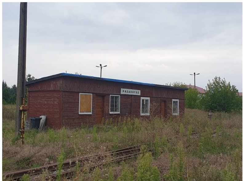
Rysunek 12. Widok na budynek stacyjny dawnej kolei wąskotorowej – zrewitalizowany w ostatnich latach.

Do ważniejszych elementów na terenie miasta należy drewniany budynek stacyjny z ok. 1925 roku oraz most stalowy na rzece Węgiec.