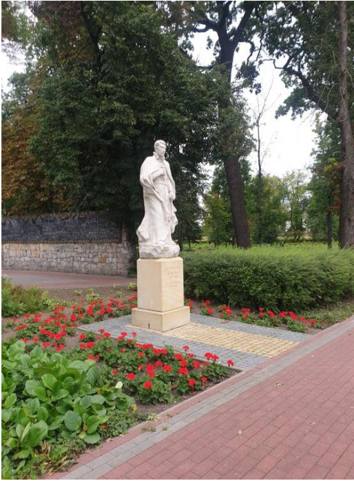
Rysunek 14. Pomnik Św. Stanisława Kostki na terenie Parku Miejskiego – patrona miasta.

Drugim parkiem zlokalizowanym na terenie miasta jest park przy dawnej szkole rolniczej przy ul. Ruda 1. Park jest w kształcie nieregularnego wieloboku, zbliżonego do trapezu o osi wydłużonej z południa ku północy.