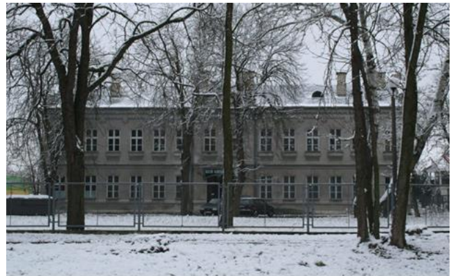
Rysunek 11. Widok na budynek nr 3 na terenie dawnego zespołu koszarowego – wpisany do Rejestru Zabytków Województwa Mazowieckiego.

Budynki stanowią element powstałych na początku XX w. Koszar carskich, które przez dziesięciolecia stanowiły miejsce stacjonowania zaborczych wojsk. Po roku 1915 w miejsce Rosjan pojawili się w nich Niemcy, którzy 11.XI.1918 zostali wyparci przez żołnierzy z Polskiej Organizacji Wojskowej. W okresie II wojny światowej obiekty koszarowe znów zajęte były przez wojska niemieckie, by ostatecznie przejść w posiadanie Wojska Polskiego i pełnić rolę Szkoły Podchorążych Wojsk Radiolokacyjnych. Wszystkie budynki zespołu są jednorodne pod względem stylowym i architektonicznym stanowią przykład architektury eklektycznej z bogatym wykorzystaniem form neoklasycystycznych. Zastosowanie przy budowie czerwonej cegły oraz oszczędnej dekoracji architektonicznej sprawiają, iż budynki te są przykładem budownictwa typowego dla wojskowej architektury carskiej tamtego okresu.