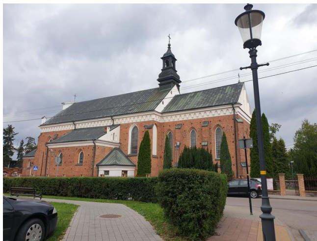
Rysunek 9. Widok na Kościół pw. NMP.

Kościół p.w. św. Klary i Józefa pochodzi z lat 1609-1616, budowę klasztoru ukończono w 1615 roku. Oba budynki zostały zniszczone przez pożary w 1622 i 1645 r., następnie odbudowane w latach 1685 i 1786-9, a odrestaurowane w 1840 r. Ponownie zostały uszkodzone w czasie I wojny światowej i odremontowane po 1916. Podczas II wojny światowej zamienione przez Niemców na więzienie, później spichlerz. W latach 80. XX w. dobudowane zostało nowe skrzydło klasztorne.