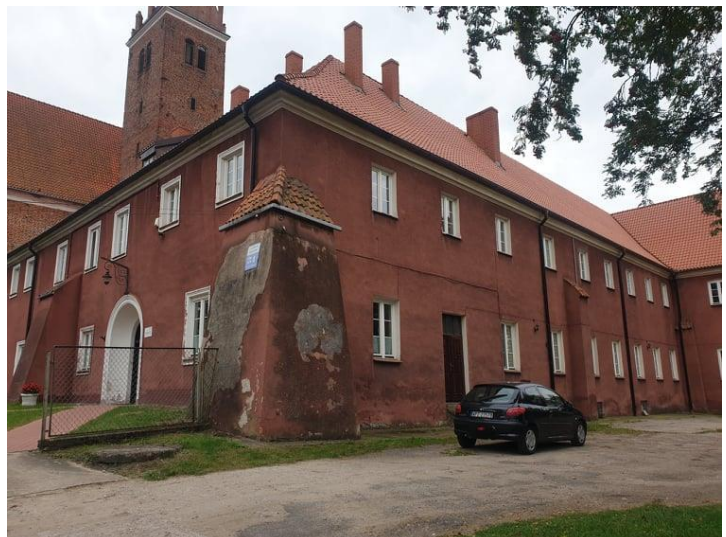
Rysunek 8. Widok na Klasztor Pobernardyński.

KLASZTOR POBERNARDYŃSKI Obiekt wczesnobarokowy. Przylegający od północy do kościoła pw. Św. Jakuba i Anny. Trzy skrzydła klasztoru i budynek kościoła otaczają prostokątny wirydarz. Skrzydła dwukondygnacyjne, przykryte dwuspadowymi dachami. Dachy kryte dachówką. W czasie II wojny światowej w klasztorze mieściły się szpital i więzienie.