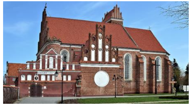
Rysunek 7. Widok na Kościół pw. Św. Jakuba i Anny.

KOŚCIÓŁ PW. ŚW. JAKUBA I ANNY Kościół wzniesiony dla zakonu Bernardynów sprowadzonych do Przasnysza w 1588 r. Stanowi świadectwo obecności w Przasnyszu ojców Bernardynów od roku 1588 aż do kasaty zakonu w 1864 r. Zrujnowane w czasie I wojny światowej budynki w 1923 r. przejął klasztor OO. Pasjonistów. W czasie II wojny światowej kościół zamieniono na spichlerz.