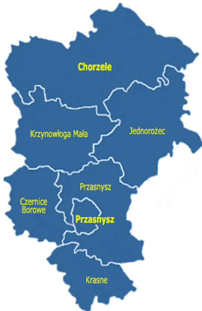
Rysunek 2. Położenie miasta na tle powiatu przasnyskiego [3].