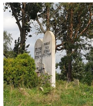
Rysunek 15. Widok na Cmentarz żydowski przy ul. Leszno 45.

W głębi cmentarz otoczony jest użytkami rolnymi. Teren cmentarza jest lekko nachylony ku północy, w stronę rzeki Węgiejki.