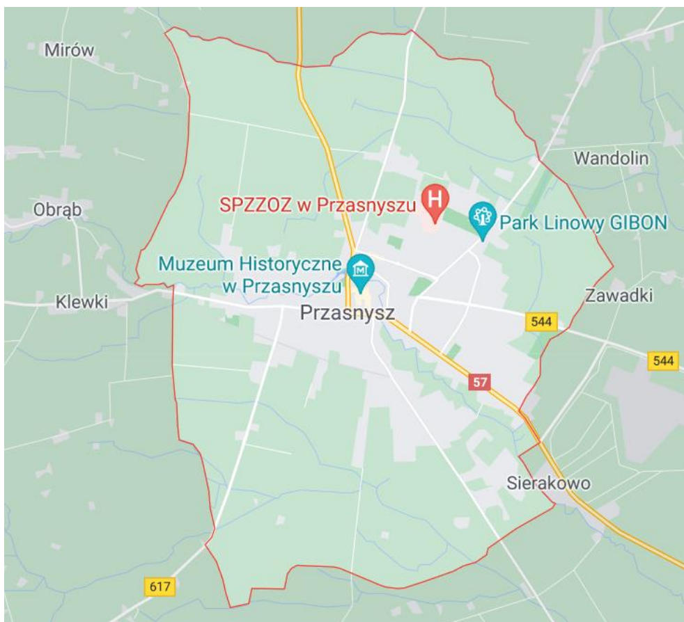
Rysunek 1. Granice miasta Przasnysz [2].

Miasto otoczone jest prawie w całości gminą Przasnysz, a na krótkim odcinku, niespełna 1,4 km, na zachodzie graniczy z gminą Czernice Borowe.